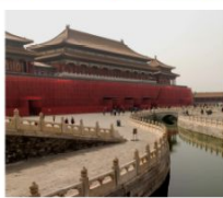
พระราชวังกู้กง