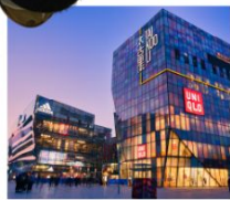
ย่านซานหลี่ตุ่น