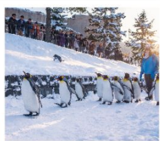
สวนสัตว์อาซาฮิยาม่า

โรงงานขนมหวานริวเก็ตสึ / LAKE AKAN SNOW ACTIVITY ทะเลสาบมะซุ / ล่องเรือตัดน้ำแข็ง / สวนสัตว์อาซาฮิยาม่า บิโอบี สโนว์แลนด์ / ภูเขาโมอิวะ / ตลาดซังคะกุ / พิพิธภัณฑ์หอคองดนตรี นาฬิกาไอน้ำโบราณ / โรงเป่าแก้วคิตาฮิชิ / มิซุยะ เอ้าเล็ทต์ ถนนช้อปปิ้งทานุกิโคจิ / ย่านซูซุกิโนะ