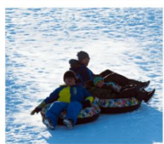
บิโอบี สโนว์แลนด์