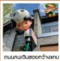
ถนนคนเดินระหว่งว้างเกน