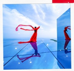
กระเจกกิ่งท้องฟ้า