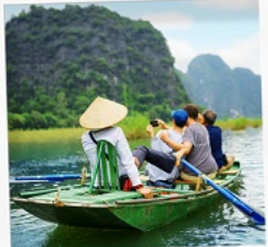
ล่องเรือ Tamcoc