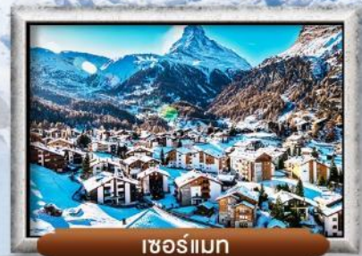
เซอร์แมท

บินทรู สายการบิน Full Service | พิเศษ! ล้มลองฟองดู 3 ชนิด