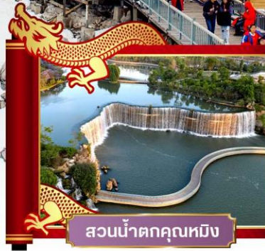
สวนน้ำตกคุณหมิง

✓ พิเศษ! โชว์จางอวี๋ใหม่่ว "ความประทับใจลี่เจียง"