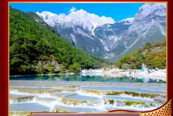
ทะเลสาบไป๋สฺยเหอ