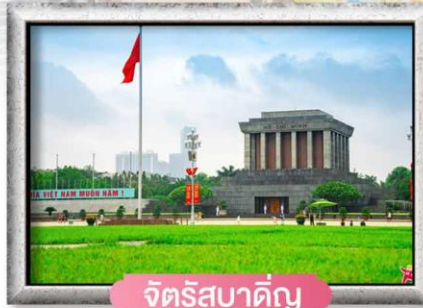
จัตุรัสบาตัญ