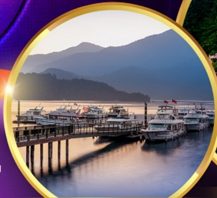
ล่องเรือทะเลสาบสุริยจันทราร