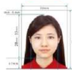
Size: 35mm x 45mm Paper Photo for Visa Application Form