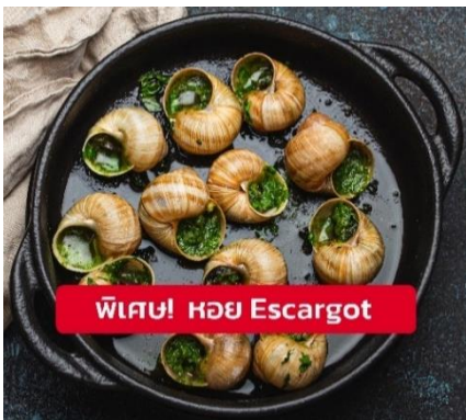
พิเศษ! หอย Escargot

เย็น ๑๐ รับประทานอาหารเย็น (มื้อที่8) เมนูพิเศษ!! หอยเอสคาโก้ (Escargot)