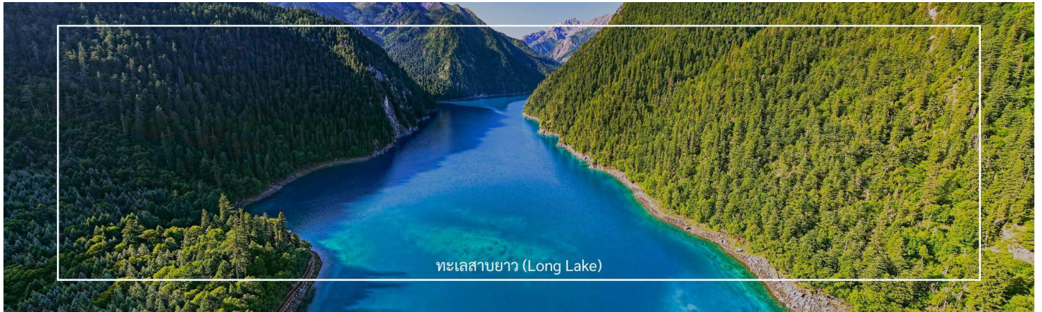
ทะเลสาบยาว (Long Lake)

ทะเลสาบนกยูง (Peacock Lake) หรือ ทะเลสาบดอกไม้ห้าสี