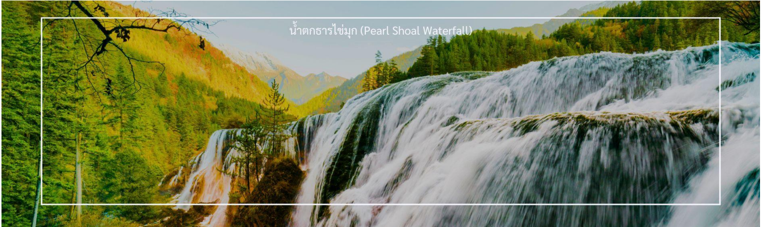
น้ำตกธารไข่มุก (Pearl Shoal Waterfall)

ชื่อของน้ำตกแห่งนี้มาจากรูปร่างของน้ำตกที่ไหลลงมาเป็นชั้นๆ คล้ายสายไข่มุกที่เปล่งประกาย น้ำตก Pearl Shoal เป็นน้ำตกที่ใหญ่ที่สุดในอุทยานแห่งชาติจิวจ้ายโกว มีรูปร่างคล้ายพัด กว้าง 160 เมตร สูงจากระดับน้ำทะเล 2,433 เมตร น้ำไหลลงมายาว 310 เมตร นอกจากนี้ยังเคยเป็นสถานที่ถ่ายทำภาพยนตร์เรื่อง Journey to the West อีกด้วย