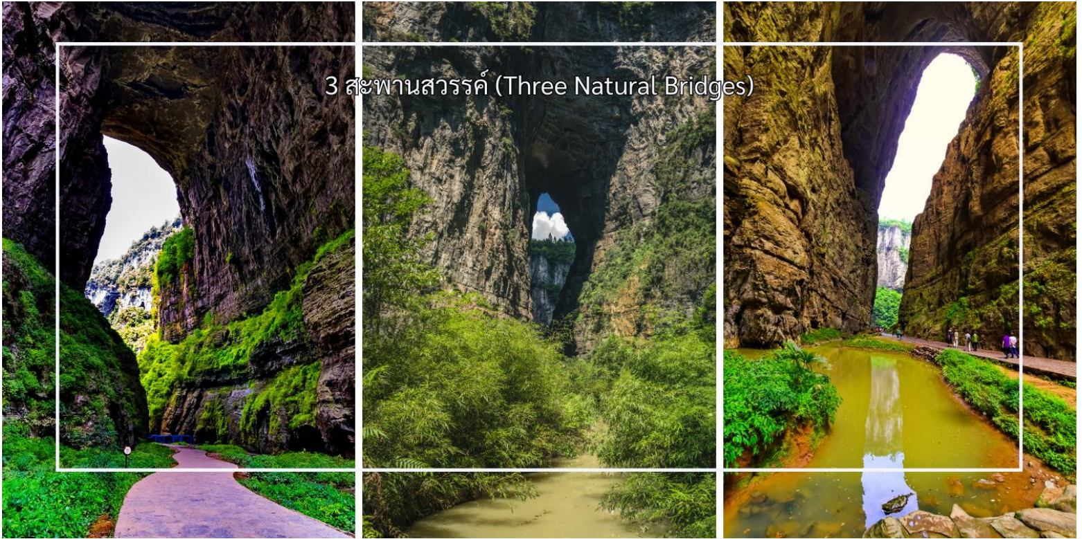
3 สะพานสวรรค์ (Three Natural Bridges)