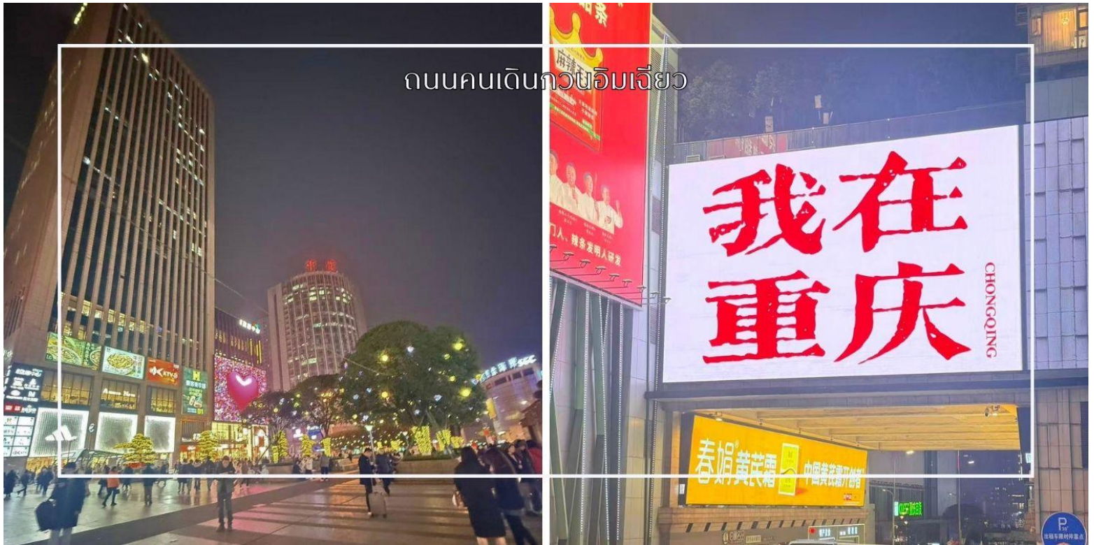
ถนนคนเดินกวนอิมเจียว

ซึ่งอย่างแท้จริง อีกหนึ่งไฮไลท์สำคัญคือจุดถ่ายภาพยอดนิยม ป้ายไฟ 我在重庆 (I am in Chongqing) ซึ่งถือเป็นแลนด์มาร์ก เช็คอินที่นักท่องเที่ยวไม่ควรพลาด