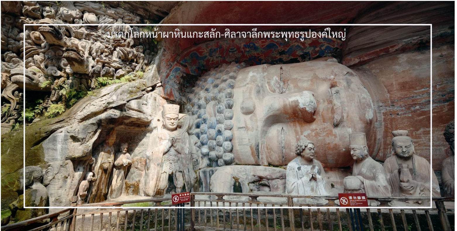
มรดกโลกหน้าผาหินแกะสลัก-ศิลาจากลี้พระพุทธรูปองค์ใหญ่

สะพานลอยฟ้า Raffles City Chongqing ไฮไลต์สำคัญคือสะพานกระจกยาวประมาณ 300 เมตร ซึ่งเชื่อมอาคารสูง 4 หลังเข้าด้วยกัน และถือเป็นหนึ่งใน skybridge ที่สูงและยาวที่สุดในโลก ภายในประกอบด้วยจุดชมวิวพื้นกระจก ร้านอาหาร สวนลอยฟ้า คาเฟ่ และพื้นที่ชมวิวแบบพาโนรามา สามารถมองเห็นวิวแม่น้ำและเส้นขอบฟ้าของเมืองฉงชิ่งได้แบบ 270 องศา