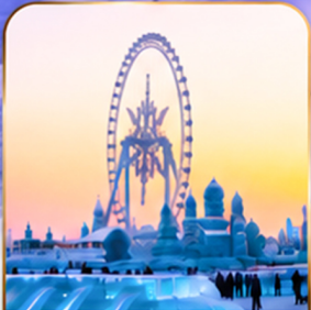
เทศกาลแกะสลักน้ำแข็ง Harbin Ice and Snow Festival