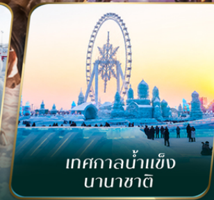
เทศกาลน้ำแข็ง นานาชาติ