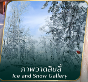
ภาพวาดสิบลี้ Ice and Snow Gallery

คอนเฟิร์มออกเดินทาง ตั้งแต่ 15 วัน ขึ้นไป