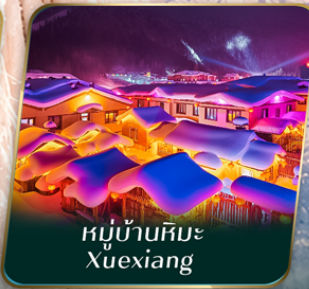
หมู่บ้านหิมะ Xuexiang