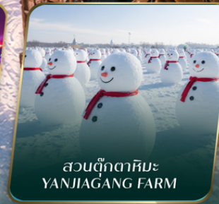
สวนตุ๊กตาหิมะ YANJIAGANG FARM