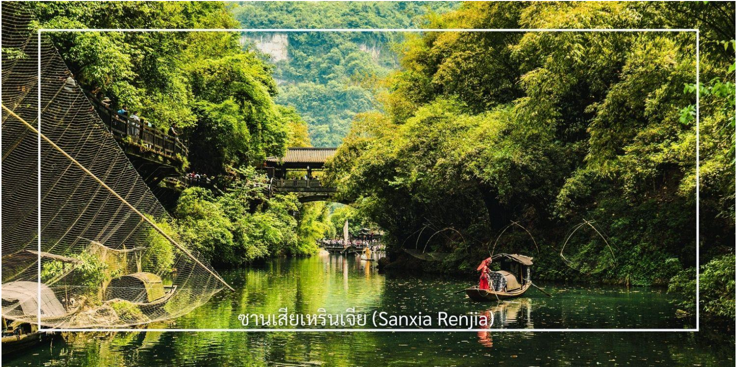
ซานเซียเหรินเจีย (Sanxia Renjia)

นำท่านสู่ หมู่บ้านซานเซียเหรินเจีย (Sanxia Renjia) (รวมล่องเรือ) สถานที่นี้เป็นที่รู้จักกันในชื่อ หมู่บ้านสามผา แหล่งท่องเที่ยวระดับ 5A ตั้งอยู่ในเขตหุบเขาสามผา ริมแม่น้ำแยงซีเกียง โดดเด่นด้วยทัศนียภาพทางธรรมชาติอันงดงามของภูเขา หินผา สายน้ำ และหุบเขาที่โอบล้อมกันอย่างกลมกลืน สถานที่แห่งนี้สะท้อนวิถีชีวิตดั้งเดิมของชาวลุ่มแม่น้ำแยงซีเกียง ผ่านสถาปัตยกรรมพื้นบ้าน วัฒนธรรม ประเพณี ที่ยังคงเอกลักษณ์ไว้อย่างครบถ้วน พร้อมให้ท่านได้ชมการแสดงเรื่องราวเกี่ยวกับวิถีชีวิตควบคู่กับสายน้ำ