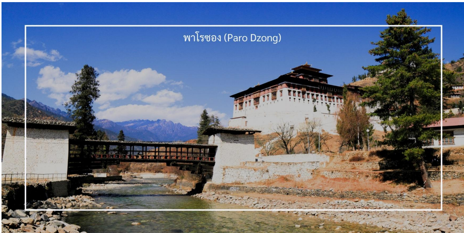
พาโรซอง (Paro Dzong)

เที่ยวชม พาโรซอง (Paro Dzong) เป็นหนึ่งในสถาปัตยกรรมที่สำคัญและสวยงามที่สุดในภูฏาน ตั้งอยู่ในเมืองพาโร (Paro) และมีบทบาทสำคัญทั้งในด้านศาสนาและการปกครอง สร้างขึ้นในปี 1646 เพื่อใช้เป็นที่ทำการของรัฐบาลและวัดประจำเมือง พาโรซองเป็นสัญลักษณ์ของความเข้มแข็งและความเป็นอิสระของภูฏาน