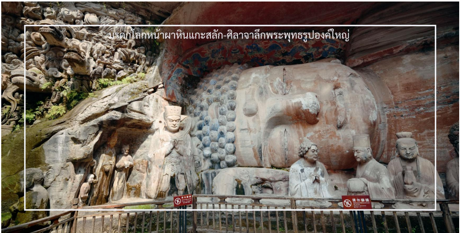
มรดกโลกหน้าผาหินแกะสลัก-ศิลาจากลี้พระพุทธรูปองค์ใหญ่

สถานที่สำคัญทางประวัติศาสตร์และศิลปกรรมอันล้ำค่า ตั้งอยู่ที่เขาเป่าตังซาน เมืองต้าจู๋ มณฑลเสฉวน ประเทศจีน ได้รับการขึ้นทะเบียนเป็นมรดกโลกโดยองค์การยูเนสโก ผลงานแกะสลักบนหน้าผาหินเหล่านี้มีอายุย้อนไปกว่า 1,200 ปี เป็นศิลาจากลี้พระพุทธรูปขนาดใหญ่ รวมถึงภาพจำหลักอันวิจิตรสะท้อนถึงแนวคิดพุทธศาสนา เต่า และขงจื้อ ที่ผสมผสานอยู่ในงานศิลป์เดียวกัน ซึ่งภายในจะมีจุดเด่นที่สำคัญอันได้แก่