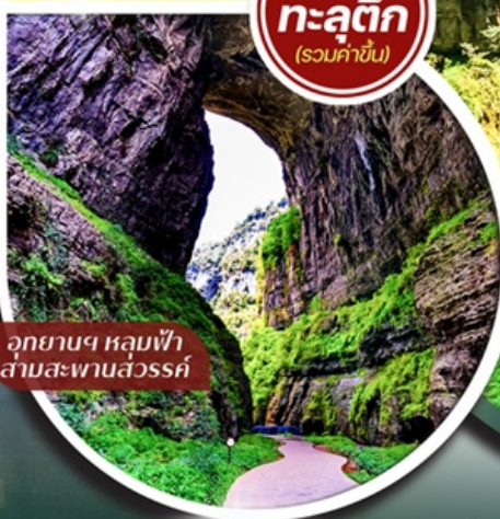
อุทยานฯ หลุมฟ้า สามสะพานสวรรค์