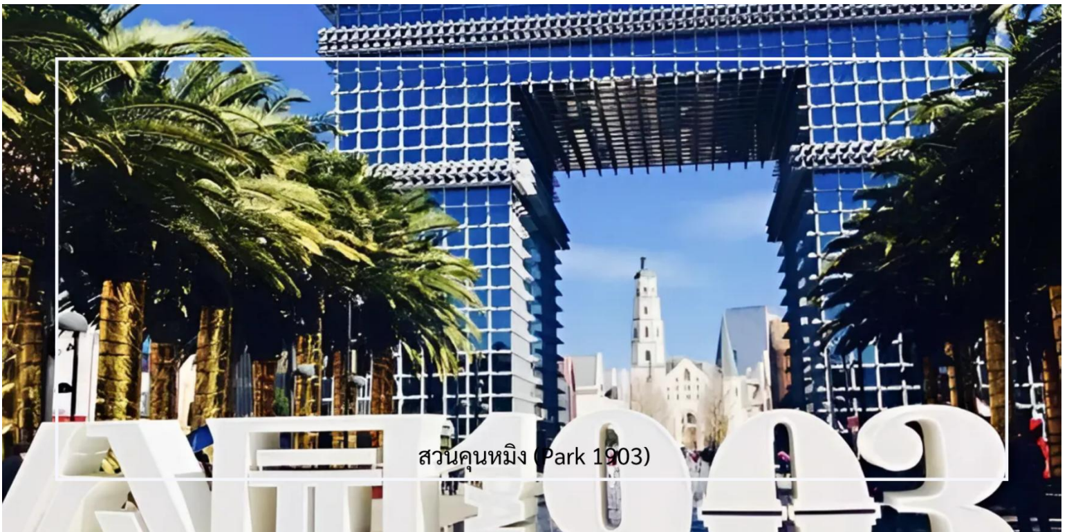
สวนคunหมิง (Park 1903)

จากนั้นนำท่าน ชมสวนคunหมิง (Park 1903) เป็นสวนสาธารณะ เหมาะสำหรับการพักผ่อนและเพลิดเพลินกับธรรมชาติ สวนแห่งนี้มีพื้นที่กว้างขวาง มีเส้นทางเดินเล่น สนามหญ้า และพื้นที่สำหรับกิจกรรมต่างๆ นอกจากนี้ยังมีต้นไม้และดอกไม้ที่หลากหลาย ทำให้สวนมีบรรยากาศสดชื่นและสงบเงียบ