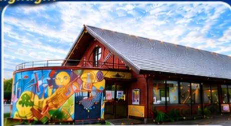
หมู่บ้านราเมนอาซาฮิกาวะ