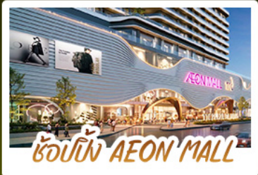
ช้อปปิ้ง AEON MALL