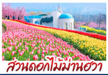
สวนดอกไม้ม้าฮาวา