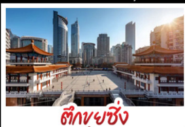
ตึกขุยซิง

พระแกะสลักหินต้าจู้ - หลุมฟ้าสะพานสวรรค์ - เวนางฟ้า ตึกขุยซิง - ตึกตะเกียบ - หมู่บ้านโบราณฉือซีโจว