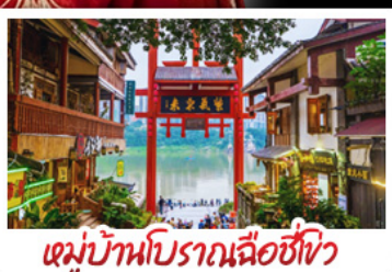
หมู่บ้านโบราณฉือซีโจว