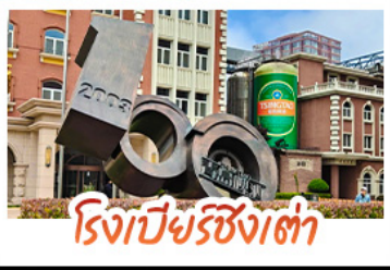
โรงเบียร์ชิงต้า