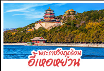
พระราชวังฤดูร้อน ฮ้อเจ้อเฉว่น