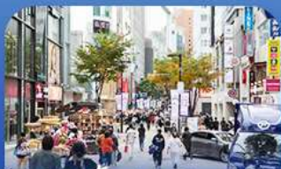
ช้อปบิงช่านเมียงดง