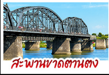
สะพานขาดถานตง

2 มหัศจอรร์ยธรรมาชาติระคัปลอก "หาคแแดงพานจึ่น" คู่กับ "ถ้ำน้ำเป็นซี" ยืนมองฝั่งเกาหลีเหนือที่ตามตง • ชมความยิ่งใหญ่ของพระราชวังสี่นหยางทุกัอง