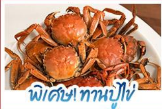
พิเศษ! ทานปูใหญ่

ปรากฏการณ์ธรรมชาติ 1 ปี มีแค่ครั้งเดียว! เตรียมชุดเก่งไปถ่ายรูปกับ 'หาดแดงผานจีน' ที่กำลังพรมสีแดงสดไปทั่วผืนน้ำ พร้อมฟินสุดขีดกับฤดูกาลทานปูที่คึกคักที่สุดแห่งปี • สัมผัสสวนนิลแห่งตะวันออกที่ต้าเหลียน