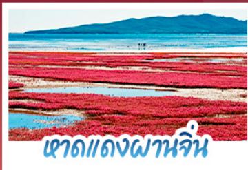
เขาดแดงผาจีน