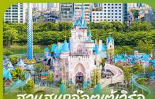
สวนสนุกโลกอเตเวเวิลด์ Lotte Adventure World