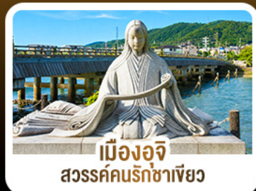
เมืองอูจิ สวรรค์คนรักชาเขียว