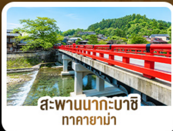
สะพานนากะบาชิ ทาดายาม่า