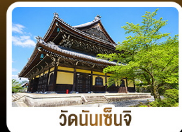
วัดนันเซ็นจิ