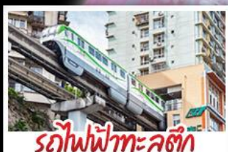
รถไฟฟ้าทะเลตุ๊ก