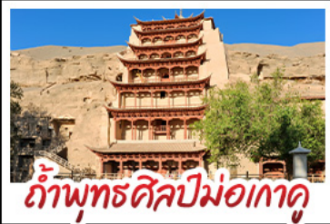
กำแพงพุทธศิลป์ม่อเกาคู

08 - 15 มิ.ย. 69 29,900 15 - 22 มิ.ย. 69 29,900 22 - 29 มิ.ย. 69 29,900 29 มิ.ย. - 6 ก.ค. 69 28,900