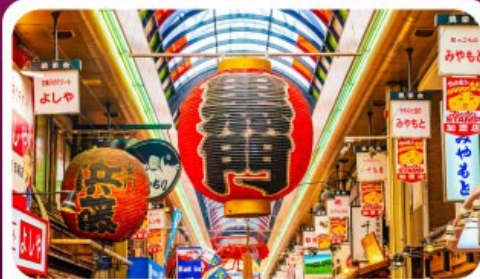
ตลาดปลาคุโรมง