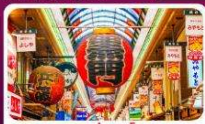
ตลาดปลาคุโรมง