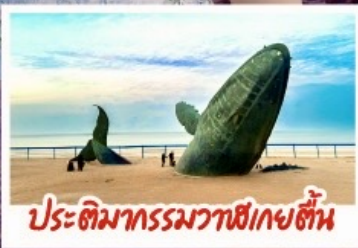
ประติมากรรมวาฬเกยตื้น