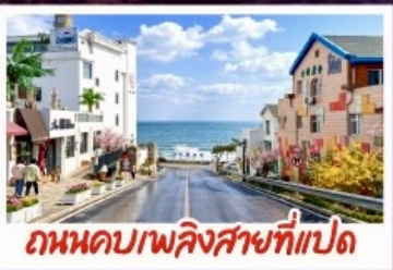
ถนนคาวาลิงสายที่แปด