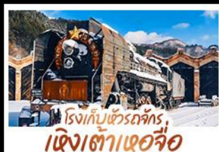
โรงเก็บข้าวรถจักร, เจิงเต่าเออจื่อ