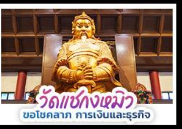
วัดเซ่งกงเซมิว ขอโชคกลาง การเงินและธุรกิจ