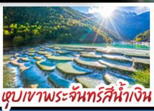
ตูปเขาพระจันทร์สีน้ำเงิน