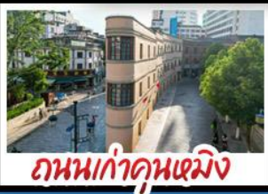
ถนนเก๋าคูหนิง