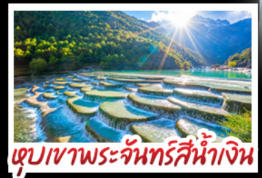
ตูปเขาพระจันทร์สีน้ำเงิน