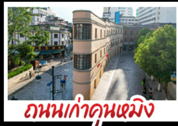
ถนนเก่าคุณหมิง