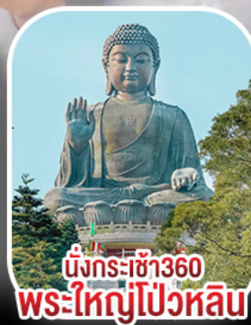
นั่งกระเช้า360 พระใหญ่โป้วหลิน