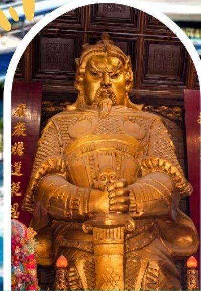
วัดแซกวง ขอพรโชคลาก การเงิน และธุรกิจ