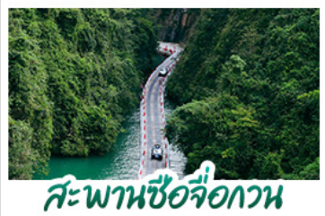
สะพานช็องจ็องกวน