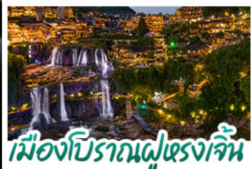
เมืองโบราณฝูหลงเจิน