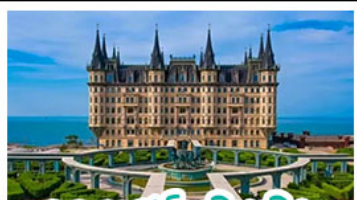
คฤหาสน์เวินนิง

เมืองเก่าซิงคโปร์ - คุกาสัมหลวมอิง เบียร์ซิงคโปร์ + อาหารทะเล สตรีทอาร์ต สตุตโตอิจิบลิ