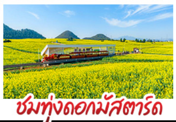
ชมทุ่งดอกมัสตาร์ด