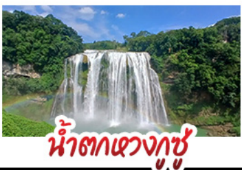
น้ำตกเขวงกูซู

14-19 พ.ย.69 ราคา 21,888 บาท / 10-15 ธ.ค.69 ราคา 19,888 บาท / 12-17 ธ.ค.69 ราคา 19,888 บาท 17-22 ธ.ค.69 ราคา 20,888 บาท / 26-31 ธ.ค.69 ราคา 23,888 บาท