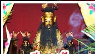
เอียงบูชิว