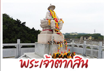
พระเจ้าตากสิน