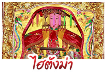
ไร่ตั้งมา

มรดกโลกบ้านดินตุ๋นไหลเวียนไหลเต็ง - สะพานเซียงจิว ไร่ตั้งมา (เจ้าแม่กัม) - เชียงบูชัว (เจ้าพ่อเสื่อ) พระเจ้าตากสินมหาราช - อ่างน้ำแร่จากธรรมชาติ ไม้ลงร้านช้อปปิ้ง - พักโรงแรม 4ดาว เมนูพิเศษ!!! อาหารแต้จิ๋ว 18 อย่าง, สุกีชีฟู๊ด ห่านพะไลต้นตำรับแต้จิ๋ว