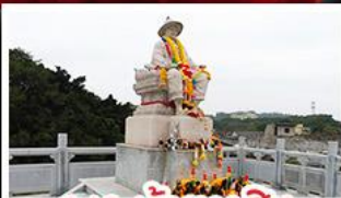
พระเจ้าตากสิน