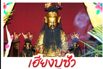
เชียงใหม่