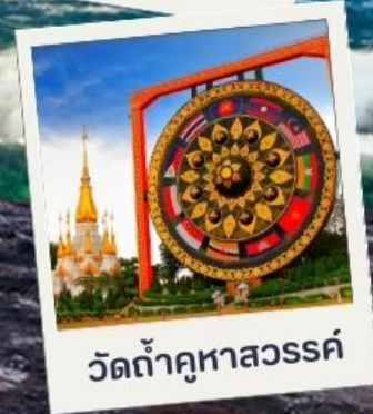
วัดถ้ำคูหาสวรรค์