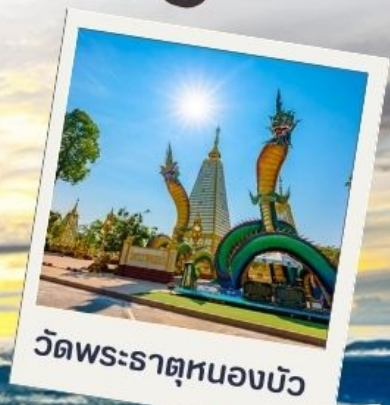
วัดพระธาตุหนองบัว