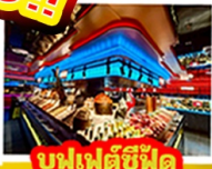
บุฟเฟ่ต์ซีฟู้ด