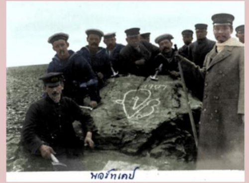
พระองค์ทรงฉาย พระรูป (ถ่ายภาพ) ณ จุด North Cape