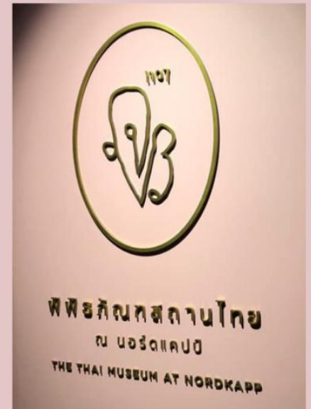
พิพิธภัณฑ์ไทยที่ Nordkapp แห่งนี้ สมเด็จพระเทพรัตนราชสุดาฯ ทรงพระกรุณาโปรดเกล้าฯ เสด็จพระราชดำเนิน เปิดพิพิธภัณฑ์แห่งนี้ในวันที่ 22 มิถุนายน พ.ศ. 2532 หรือ ค.ศ. 1989