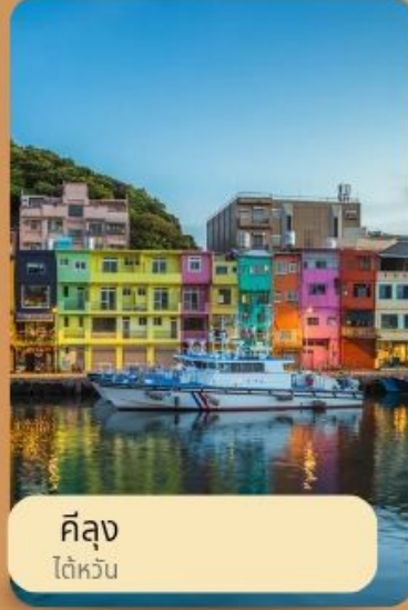
คิง ไต้หวัน