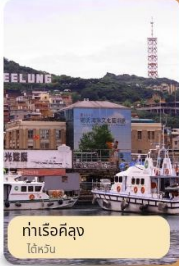
ท่าเรือคิง ไต้หวัน