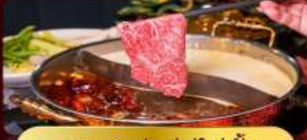
ชาบูหม่าล่าไม่อัน