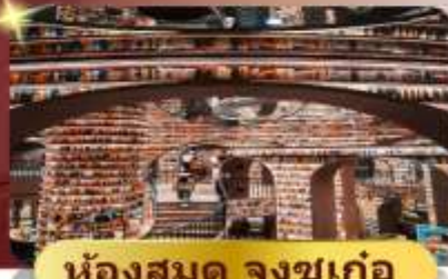
ห้องสมุด จงซูเก๋อ