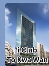
i Club To Kwa Wan