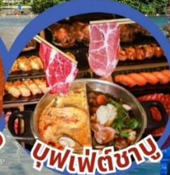
บุฟเฟ่ต์ชาบู