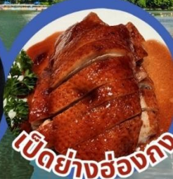
เป็ดย่างฮ่องกง