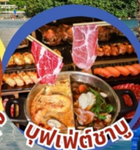
บุฟเฟต์ซาบู