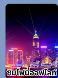
ชมไฟนีออนไฟท์