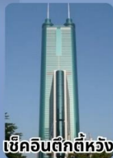
เชคอินตึกทีห้วง