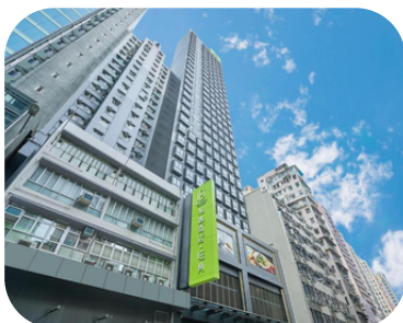
Ease Mongkok Hotel (มงก๊ก)