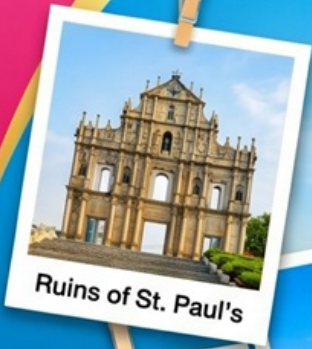
Ruins of St. Paul's