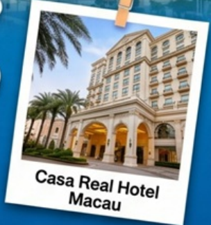
Casa Real Hotel Macau

แพ็คเกจสุดคุ้ม พักรู 4 ดาวพร้อมอาหารเช้าที่ Casa Real Hotel Macau