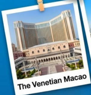
The Venetian Macao